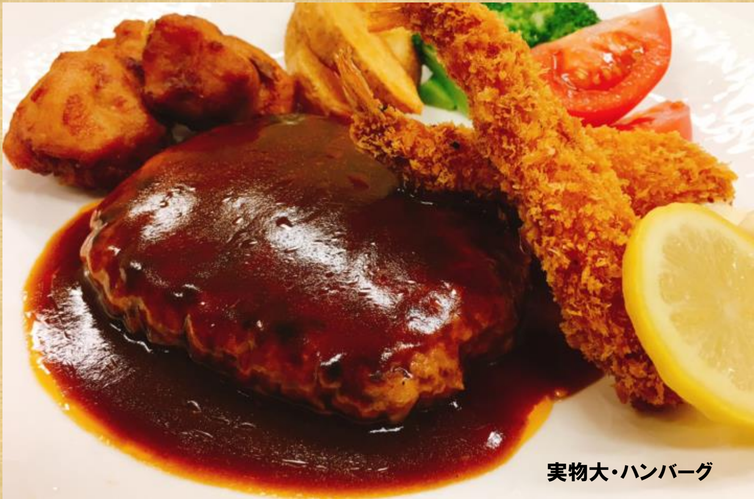
実物大・ハンバーグ